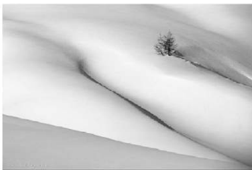
Симфонія білого. Автор — Dare Turnsek