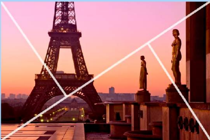
Діагоналі ілюструють правило трикутників.

Це схоже на правило третин, але замість сітки прямокутників, ми ділимо кадр діагональними лініями, що йдуть від одного кута до іншого, потім ми додаємо ще дві лінії з інших кутів. Дві менші лінії зустрічають велику лінію під прямим кутом, як це показано нижче. Це ділить кадр на ряд трикутників. Цей спосіб допомагає внести «динамічне напруження», про яке ми дізналися з правила № 6. Як з правилом третин, використовуємо лінії (в даному випадку, трикутники), щоб допомогти розташувати різні елементи в кадрі.