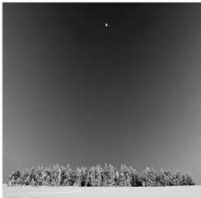
Казковий місяць. Автор — jezkech