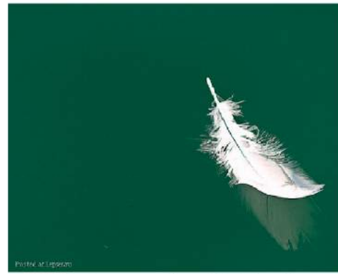
Пір'я. Автор — Grant MacDonald