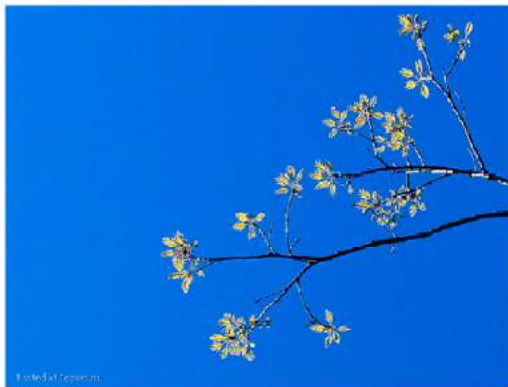
Весна. Автор — VikasAnand