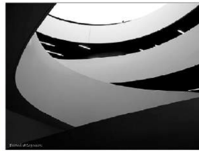
Лінії. Автор — sensorfleck