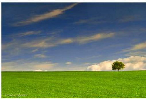
Дерево. Автор — Hassan9